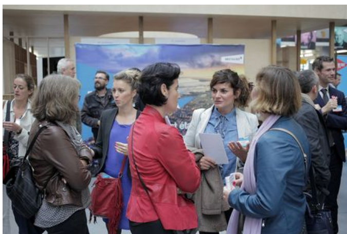
1 er Forum de l'économie, Brest, octobre 2017

Et si vous étiez bien entourés ? Ici, vous ne serez jamais seul car ensemble, nous sommes plus forts