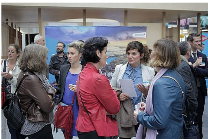
1 er Forum de l'économie, Brest, octobre 2017

Et si vous étiez bien entourés ? Ici, vous ne serez jamais seul car ensemble, nous sommes plus forts