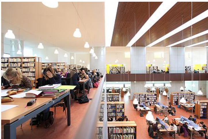
Bibliothèque universitaire

L'Université de Bretagne Occidentale, vous l'appellerez, vous aussi, très rapidement l'UBO.