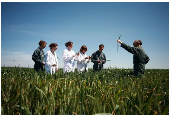
Étudiants en agronomie

Depuis plus de 200 ans, l' École Navale ➡ est au centre des grands enjeux maritimes, elle forme les marins et officiers d'aujourd'hui et de demain. Depuis 2017, l'école est devenue un établissement public à caractère scientifique, culturel et professionnel. Elle reste cependant un grand établissement sous la tutelle du Ministère des Armées dont la mission première est de former les élèves que la Marine Nationale lui confie chaque année.