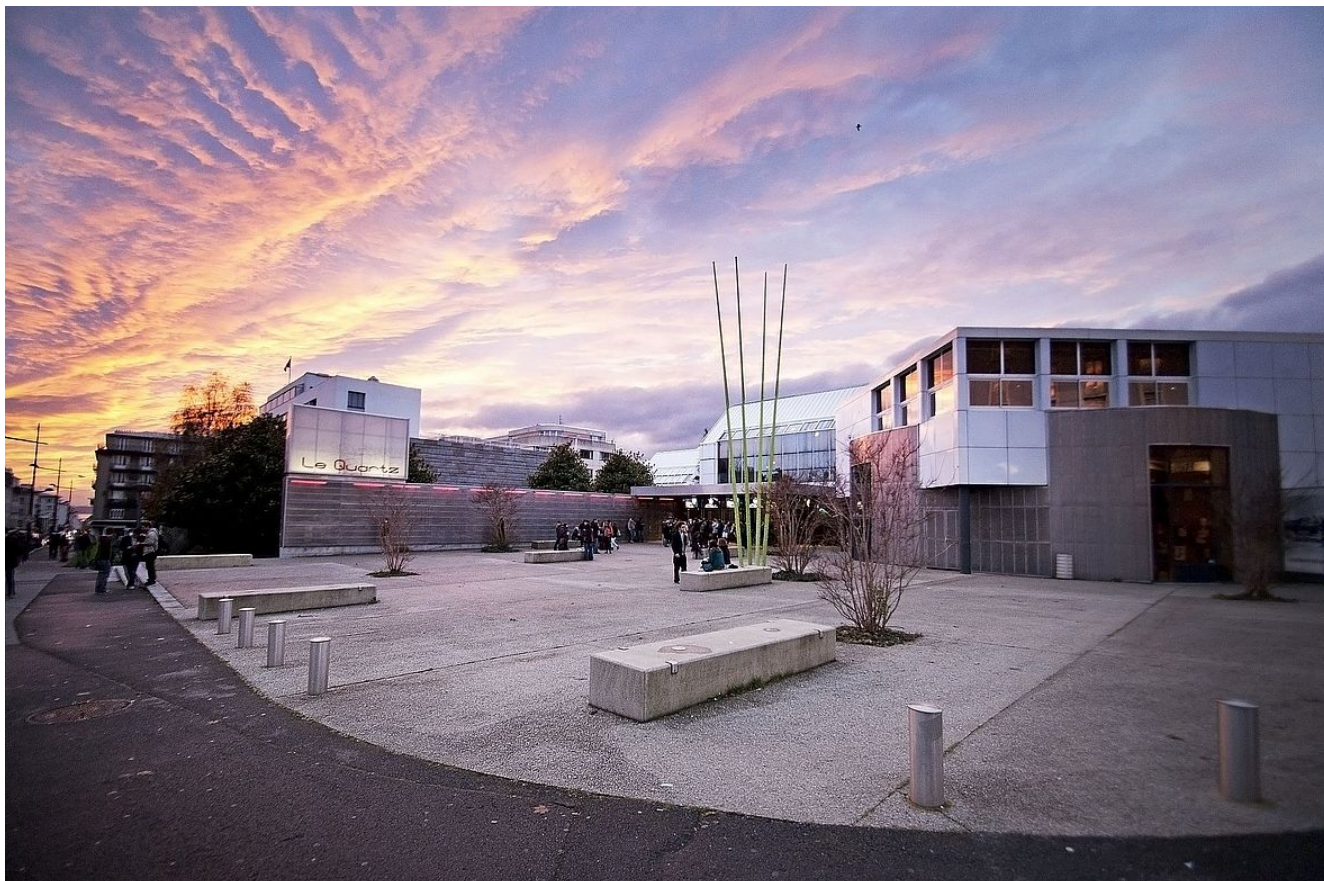
Le parvis du Quartz

de Brest Métropole, Le Quartz s'inscrit en fer de lance dans le foisonnement culturel de la ville.