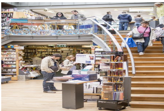
La Librairie Dialogues, lieu de culture emblématique de Brest.

Prendre le pouls d'une ville, c'est flâner le long de ses rues, pousser les portes de ses boutiques, échanger avec ses habitants, partir à la découverte de son patrimoine. Le cœur de ville de la métropole ne demande qu'à battre encore plus fort.