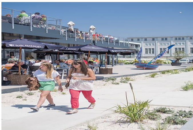
Quai Tabarly, port du Château

A Kerlouan, prenez le temps de visiter les chaumières de pêcheurs du village de Meneham. Un hameau restauré qui, après avoir accueilli des militaires puis des pêcheurs, accueille désormais des visiteurs qui peuvent librement se promener dans cet écrin caché entre les dunes et les rochers.