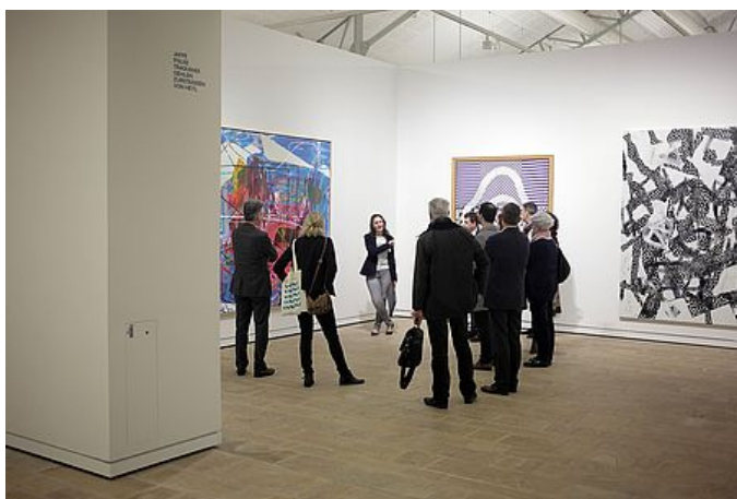
Le Fond Hélène et Edouard Leclerc, à Landerneau, est devenu en quelques années le passage obligé des amateurs d'art.

Ici, nous sommes authentiques, à l'image des pépites de notre territoire. Et si vous n'aviez pas le temps de toutes les découvrir, voici les « incontournables » du Pays de Brest, en attendant de revenir!