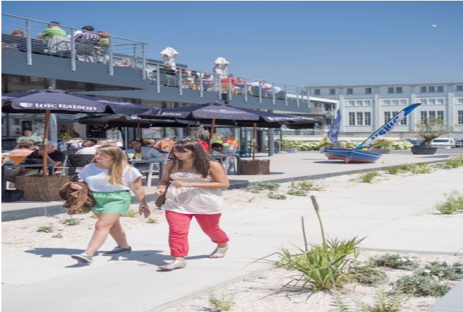
Quai Tabarly, port du Château

A Kerlouan, prenez le temps de visiter les chaumières de pêcheurs du village de Meneham. Un hameau restauré qui, après avoir accueilli des militaires puis des pêcheurs, accueille désormais des visiteurs qui peuvent librement se promener dans cet écrin caché entre les dunes et les rochers.